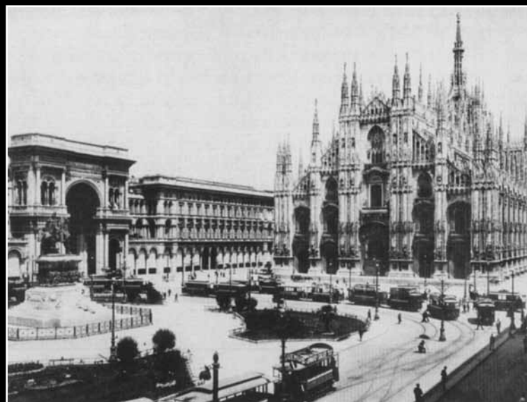
Il carosello dei tram in piazza del Duomo, Milano, inizi XX secolo

Primo esempio eclatante in questa direzione sono i